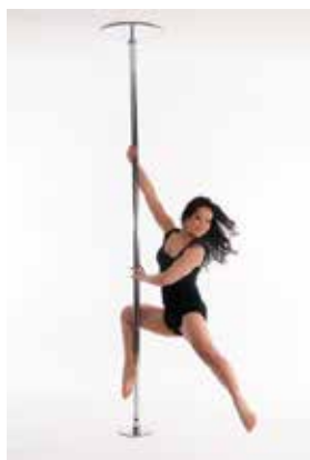
S SPIN (šestilo)