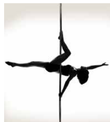
OUTSIDE LEG HANG (škorpijon)