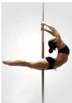
REVERSE CRESCENT MOON