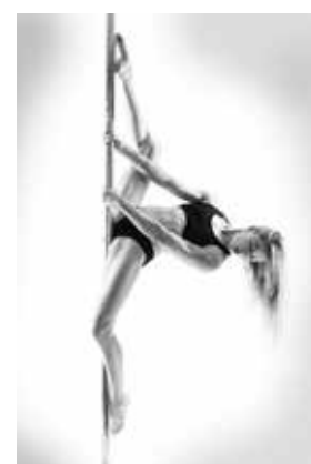
FRONT SPLIT (ženska špaga)