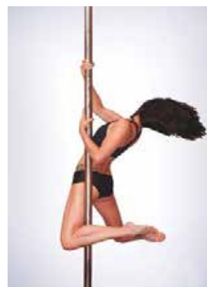
BACKHOOK SPIN (obrat nazaj)