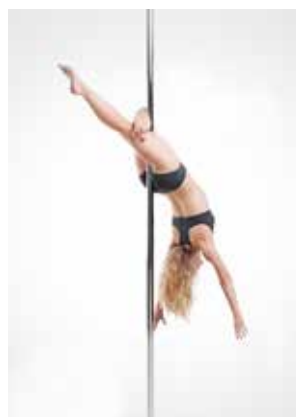
CROSSED KNEEW RELEASE (layback)