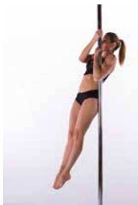
OSNOVNI OPRIJEM (vaja za moč)