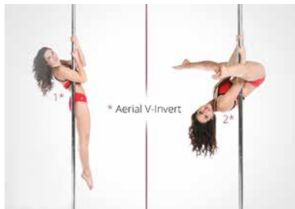
ARIAL, CHOPER (helikopter)