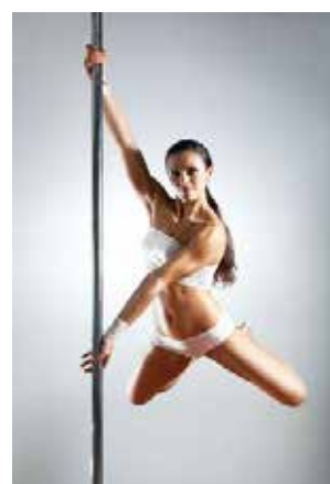
SWAN SPIN (diamant)

1. stopnja: brez dropov, dovoljena sta samo 2 elementa z boki nad glavo, sodnik lahko uvrsti koreografijo v drugo stonjo, če je le ta prezahtevna