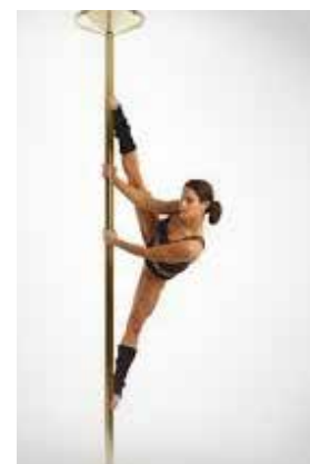
SPLITS (moška špaga)