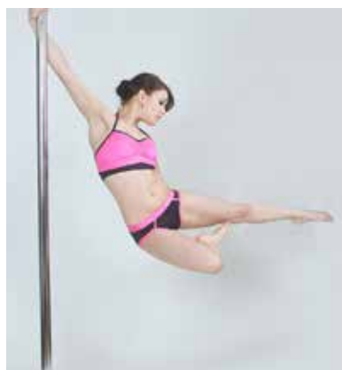
ATTITUDE (obrat na eni roki)